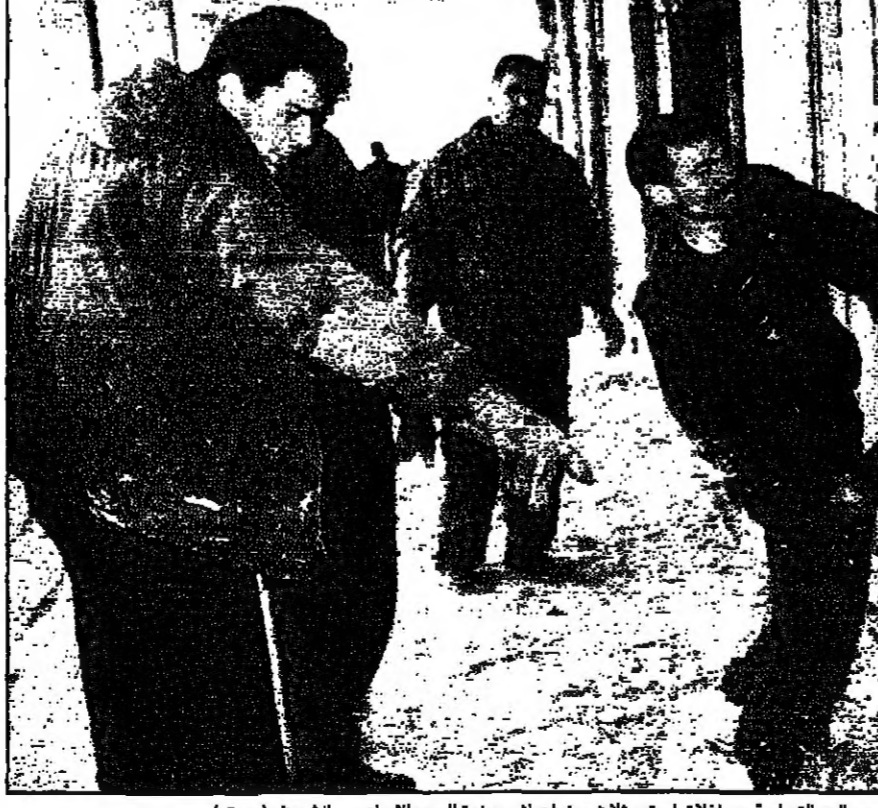
فلسطينيون يهدون فتح متاجرهم التجارية بعد اغلاق استمر ثلاث سنوات اثر حوزرة الحرم الابراهيمي الشريف (روبير)

القدس - رويترز: قالت شركة بيزيك اسرائيلي للحكوم امس الاول ان مشروعها المشترك مع الهند لانتاج التليفونات المحمولة قد اكتمل من الفني خط تليفوني منذ بدء اعماله التجارية قبل اكثر من اسبوعين. وقالت الشركة في بيان انها ملكت بترقية تهيئة من النير الاداري لمشروع فاسيل هاتيل مشروع مشترك بين شركة هيتاشيفل فيونديستريك الهندية للاتصالات التي تملك بيزيك 49 في المئة من أسهمها وشركة شيناواترا التيلاندية وشركة كوكا كولا مايندرا اند هونوسند التابعة لشركة هيتوجاس للتصوير.